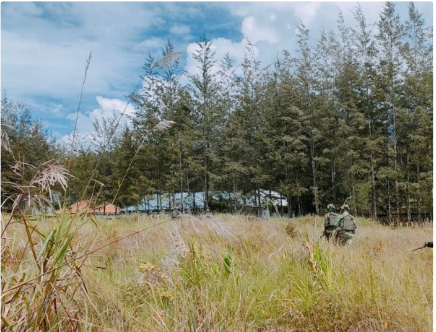
Satgas Yonif 323 Amankan Anggota OPM terduga pelaku tindak Kriminal

Satgas Mobile Yonif 323/Buaya Putih Kostrad berhasil menangkap salah satu anggota Organisasi Papua Merdeka (OPM) yang diduga terlibat dalam sejumlah tindak kriminal di wilayah Papua, Kabupaten Puncak, Penangkapan ini dilakukan